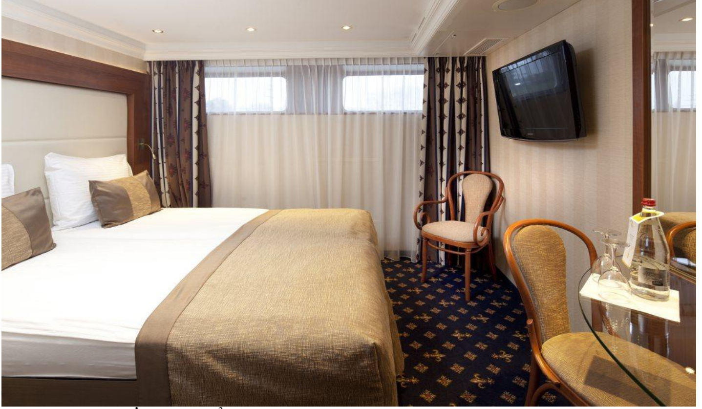
ALT KAT DIŞ KABİN (1.Kat 15 m2 )