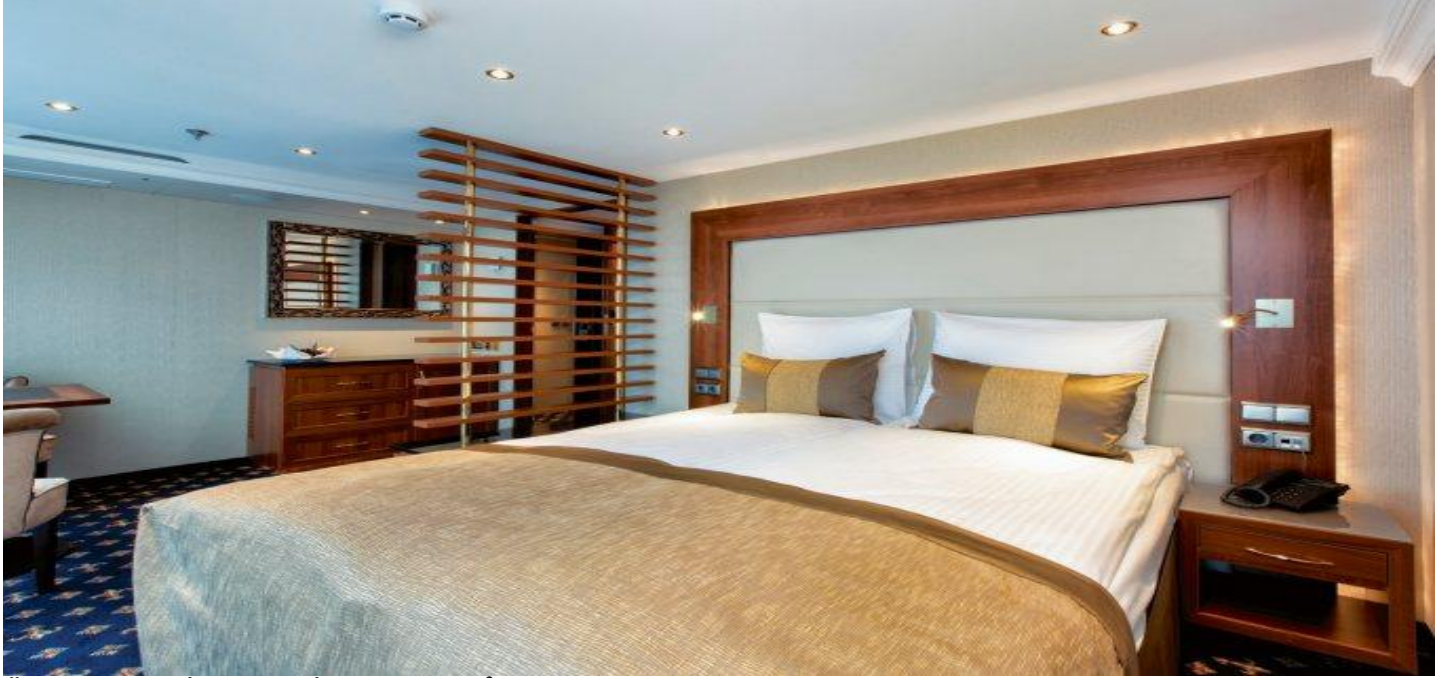
ÜST KAT SUİTE KABİN (3.Kat 22 m 2 )

2012 yılında seferlerine başlayan geminin uzunluğu 110m, genişliği 11,40m, yüksekliği 6 metre ve toplam 3 katlı olan gemide 74 kabin bulunmaktadır ve yolcu kapasitesi 148 olarak belirlenmiştir. Dış ve French Balkonlu kabinler 15 m 2 , Mini Suit kabinler 19 m 2 , Suit kabinler ise 22 m 2 büyüklüğündedir. Tüm kabinlerde; klima, Tv, telefon, minibar, kasa, saç kurutma makinası, kıyafet askısı, havlu, şampuan gibi imkanlar mevcuttur. (Suite kabinler haricindeki kabinlerde Terlik ve Bornoz bulunmamaktadır).