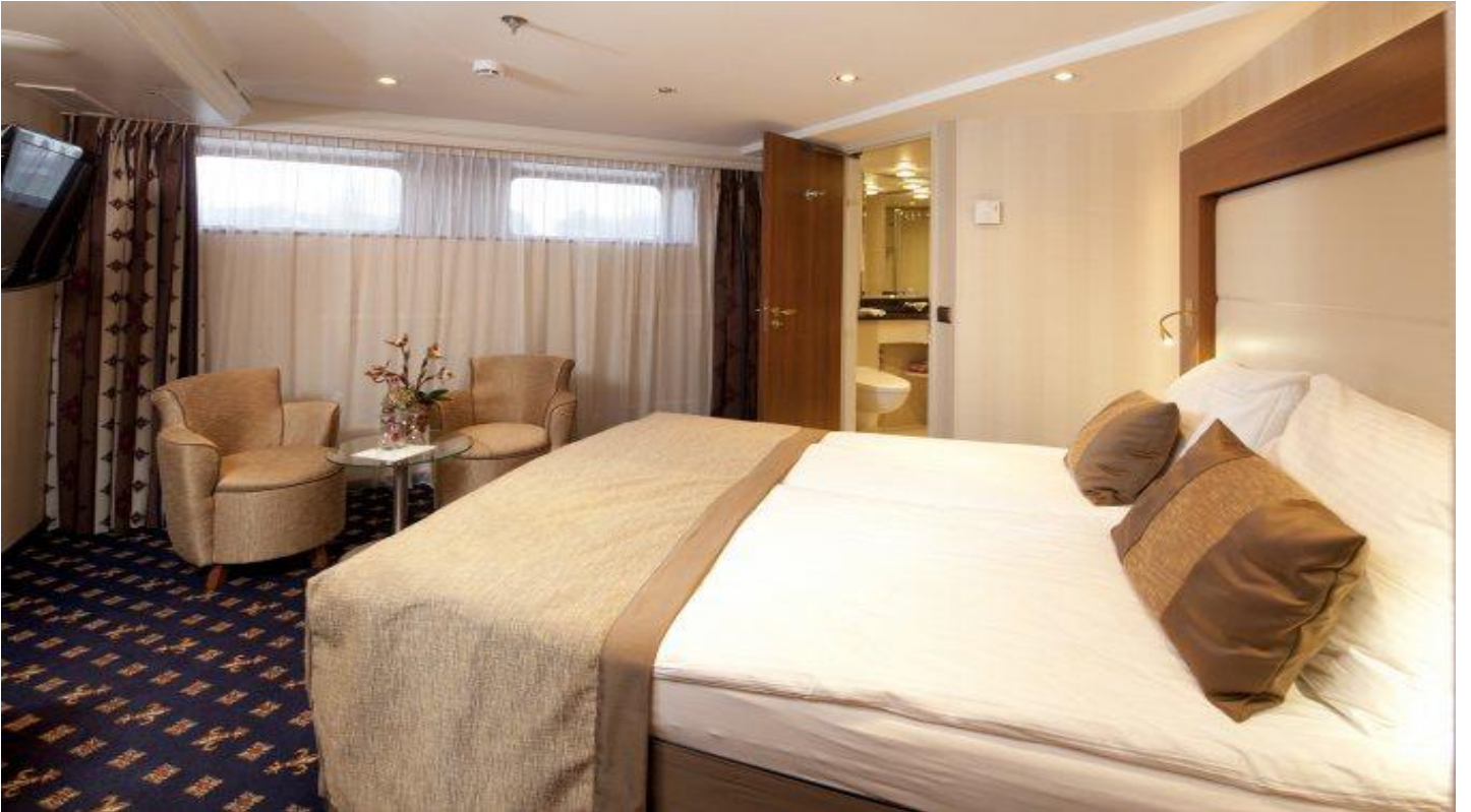
ALT KAT MİNİ SUİTE KABİN (1.Kat 19 m2 )

Merkez : Halaskargazi Caddesi Şenkal Apartmanı No:37 Kat 1 Harbiye İstanbul / Turkey