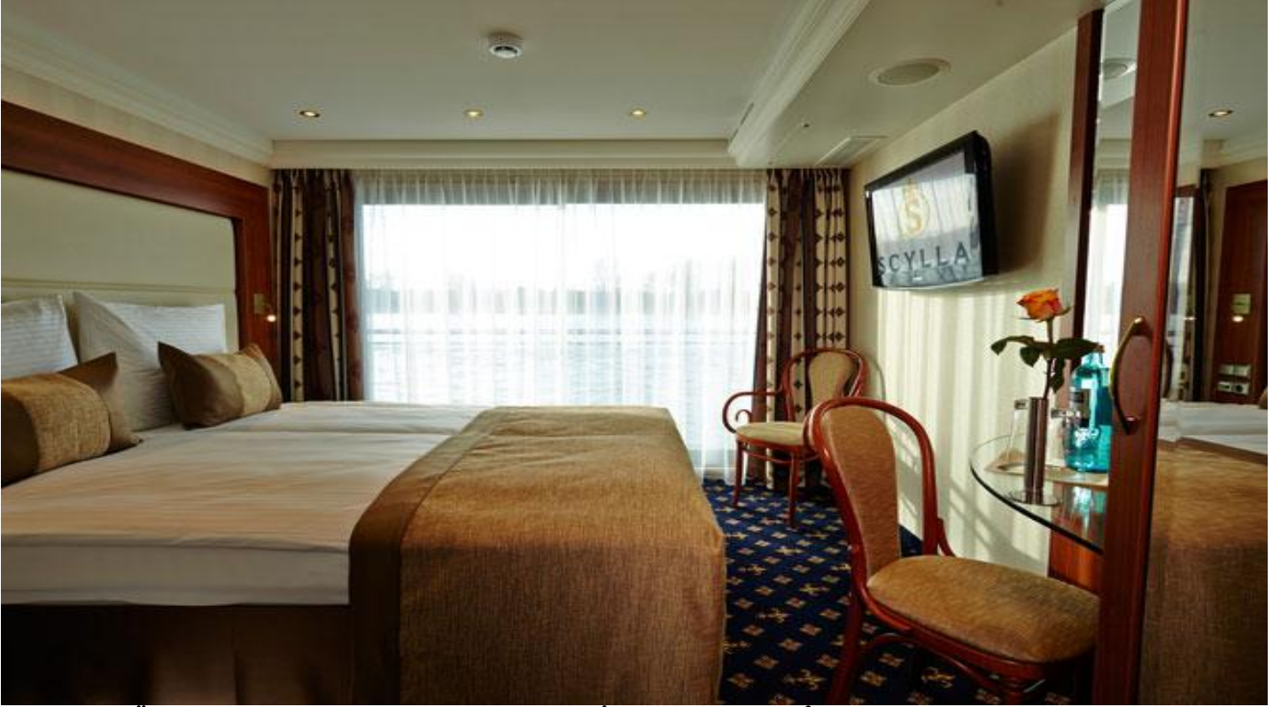
ORTA VE ÜST KAT FRENCH BALKONLU KABİN (2.ve 3.Kat 15 m2 )