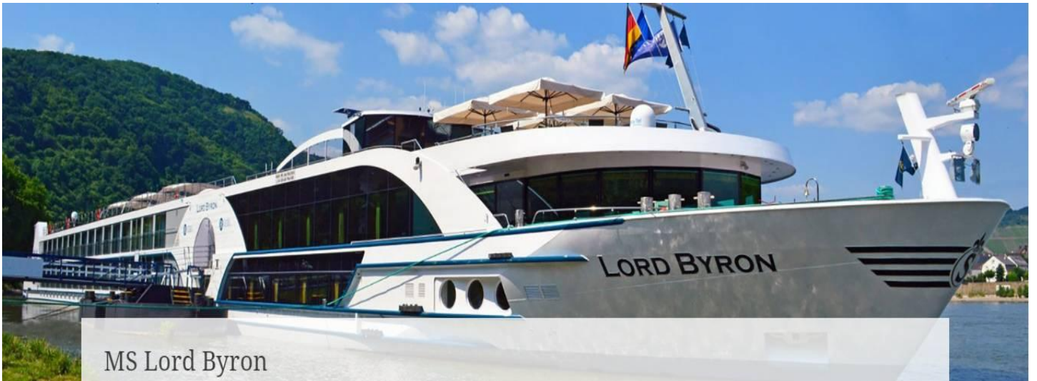
MS Lord Byron

Merkez : Halaskargazi Caddesi Şenkal Apartmanı No:37 Kat 1 Harbiye İstanbul / Turkey