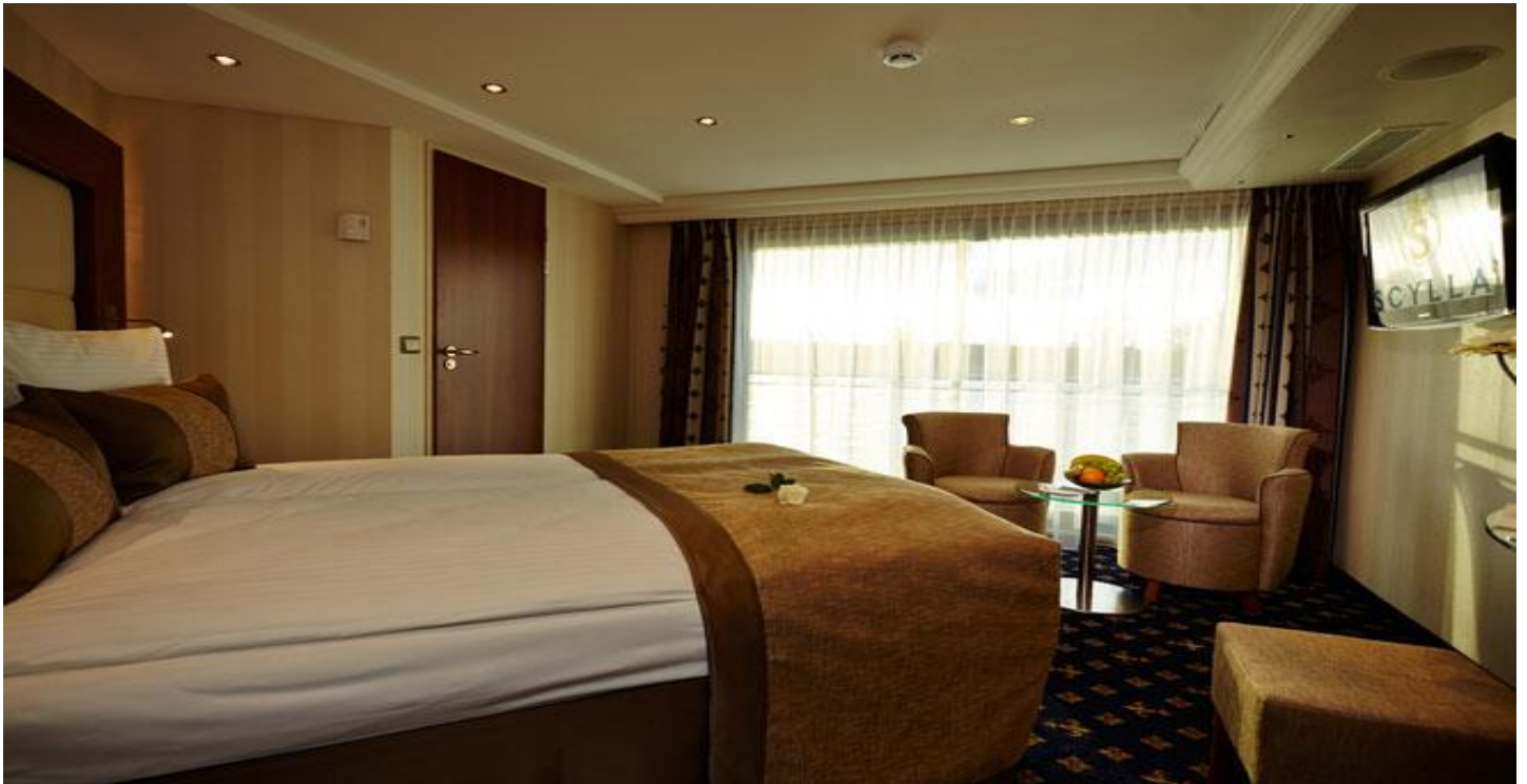
ORTA VE ÜST KAT MİNİ SUİTE KABİN (2.ve 3.Kat 19 m 2 )

Merkez : Halaskargazi Caddesi Şenkal Apartmanı No:37 Kat 1 Harbiye İstanbul / Turkey