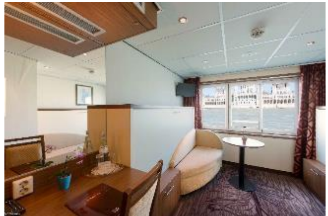
Dış Kabin Panoramik Camlı (Açılır)– Orta Kat 12,5 m 2

Merkez : Halaskargazi Caddesi Şenkal Apartmanı No:37 Kat 1 Harbiye İstanbul / Turkey