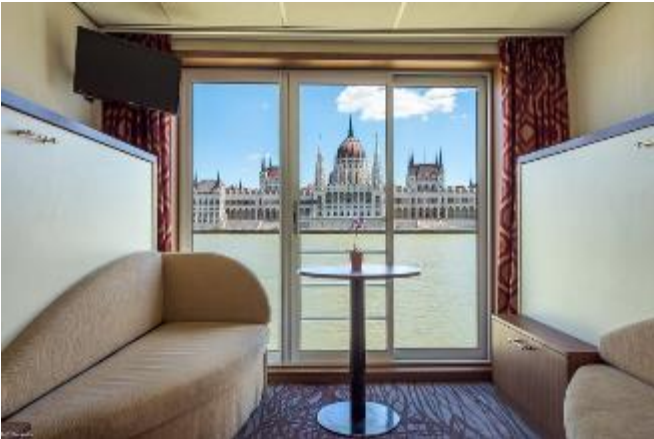
French Balkonlu Kabin – Üst Kat 12,5 m 2