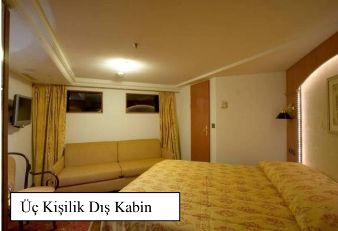
Üç Kişilik Dış Kabin