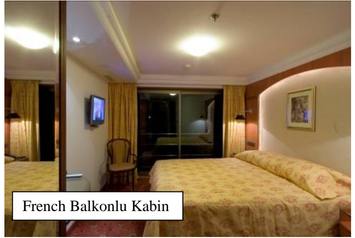
French Balkonlu Kabin