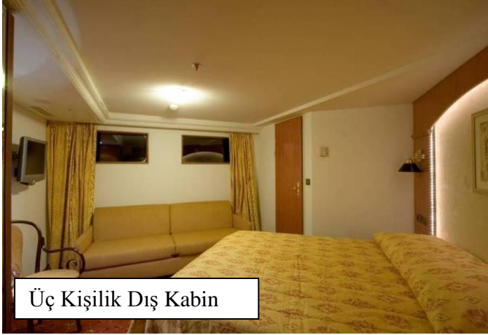
Üç Kişilik Dış Kabin